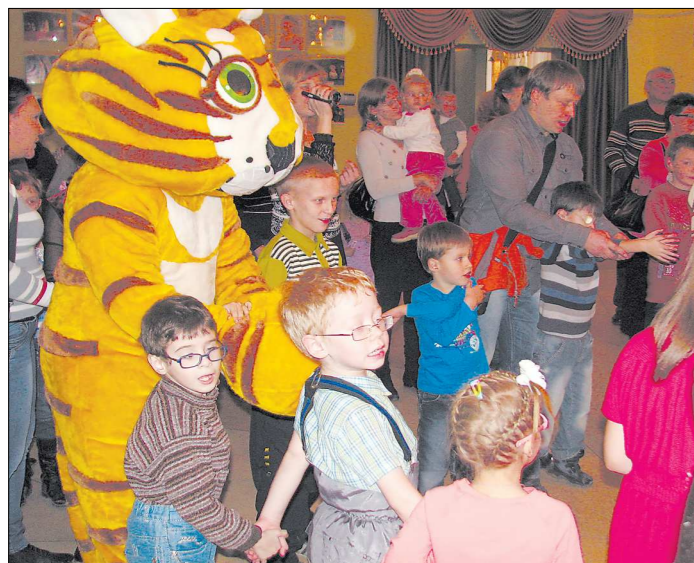
В театре ребят ждали куклы – мягкие, говорящие, добрые. Таких друзей можно полюбить не взглядываясь