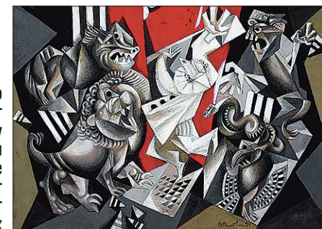
Волович нередко использует станковую графику в книге: в этом случае изображение не иллюстрирует текст, а существует с ним на равных