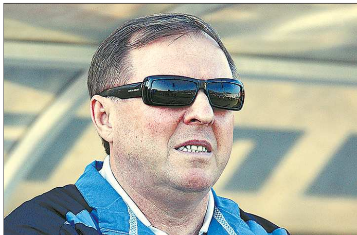
Судя по всему, появление в «Урале» нового наставника — дело ближайшего времени

После такого погружения в закулисье зрители уходят из театра как из дома. С ощущением, что прикоснулись к волшебству, где театр не ограничивается сценой, он везде.