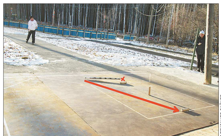
Пример городошного фокуса. Задача: выбить два лежащих по краям городка, не задев центральный стоящий. Бита закручивается так, что, сбив одним концом первый городок (красный крестик), отгибает центр и другим концом (по стрелке) летит ко второму городку