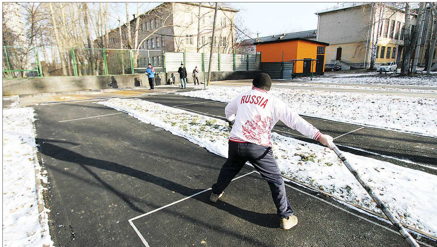
Образцово-показательный бросок от пятикратного чемпиона мира

Сейчас команда Свердловской области базируется в Верхней Пышме. Тренировки иногда проходят в Екатеринбурге, в Парке победы на Уралмаше. Коллектив обра-