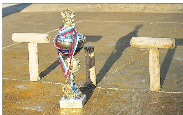
Кубок России команда из Свердловской области выиграла впервые с 2004 года