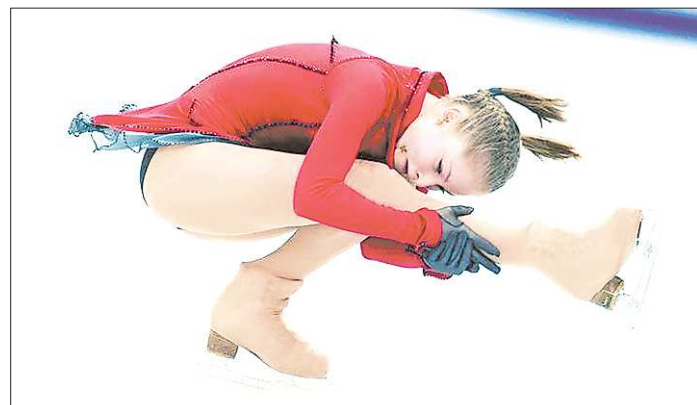
Юлия Липницкая: «Ужасный был прокат. Слава Богу, что по сумме двух программ осталась первой»