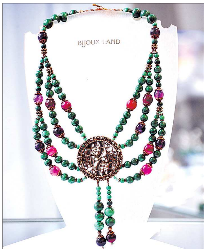
Последним, двенадцатым лотом стало ожерелье «Гора самоцветов». Оно выполнено из малахита, агата и бронзы, а в узоре диска можно увидеть образы славянского язычества: мифических оленей, утку и крылатых собак