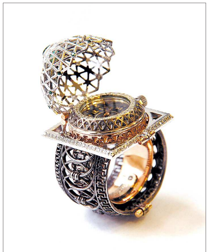
Верх кольца «Символ Екатеринбурга» напоминает купол городского цирка, под куполом прячется крошечная копия часов на здании администрации, а шинка выполнена в виде ограды Каменного моста на Плотинке