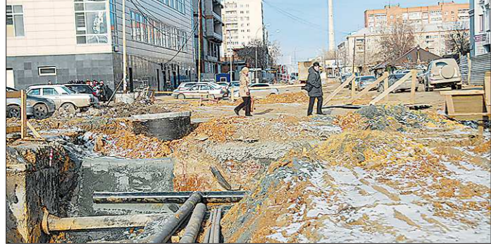
На зиму подрядчик предлагает засыпать дорогу щебнем и временно открыть две полосы для проезда