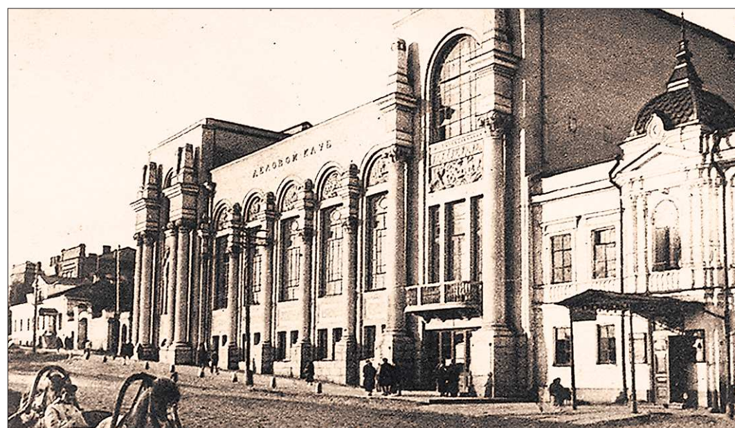
Деловой клуб. Конец двадцатых годов. В это время музыкальные концерты давались в основном в Оперном театре. Поэтому когда создавалась филармония (между прочим, третья в России — после Московской и Ленинградской) многие восприняли это настороженно

Здание было задумано в 1910 году как пристрой к обществуному собранию, которому стало тесно. Судя по всему, то был год расцвета в строительстве города. Тогда закладывалось и возводилось несколько общественных зданий. В 1913 году городскими властями был объявлен конкурс на лучшее клубное здание. Первую премию получил проект Константина Трофимовича Бабыкина. Кстати, имя этого человека знали тогда все — это был выдающийся архитектор, основатель архитектурного образования в городе. Среди его самых известных творений — гимнастический зал гимназии №9, здание Театра оперы и балета, старое здание железнодорожного вокзала... Если в конкурсе принимал участие Бабыкин, у конкурентов, в общем-то, шансов не было. Так и произошло — идея архитектора привлекла внимание комиссии прежде всего оригинальным фасадом в стиле «модерн» (к слову, зданий в этом стиле в нашем городе сохранилось совсем мало), а также функциональностью — автор спроектировал внутри клу-