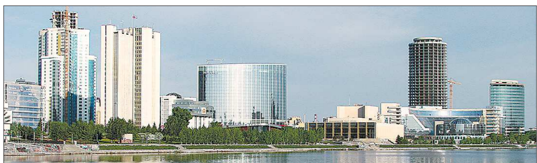
Большая часть налогов, собранных в Екатеринбурге, остаётся в городе

Ещё два 24-квартирных дома — уже для детей-сирот — будут построены на улице Кузьмина. Для Кушвы, где долгое время работал детдом, эта тема всегда актуальна. У 58 выпускников воспитательного учреждения есть судебные решения о предоставлении жилья.