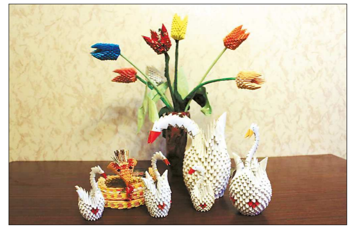
Сувениры получились – залюбуешься