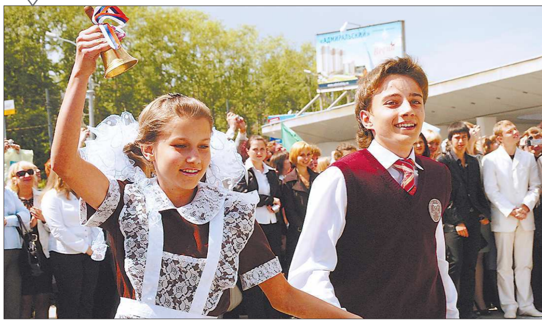
В Свердловской области узаконены основные требования к школьной одежде

«Вы полагаете, всё это будет носить?» >>> IV