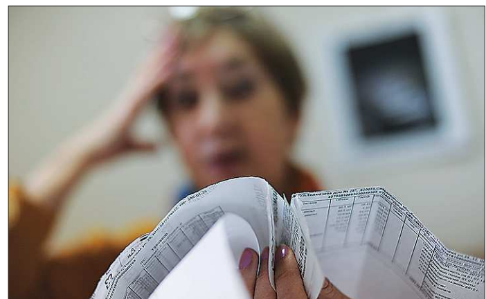
Каждое шестое обращение в администрацию Президента России — жалоба на безобразия в сфере ЖКХ

«Население на сегодняшний день — это для нас проблемная группа, и сегодня задолженность достигла почти 45 миллиардов рублей. Крайне неблагоприятная ситуация сложилась вокруг платежей в регионах Северо-Кавказского федерального округа, доля которого в общероссийской просроченной задолженности населения в настоящее время со-