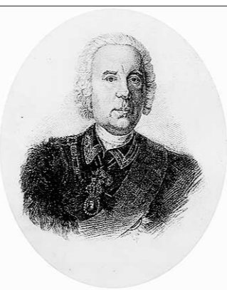
Вильгельм де Геннин