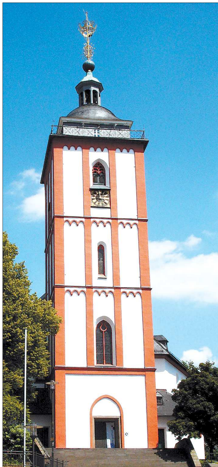
Церковь Святого Николая в Зигене, где был крещён Вильгельм де Геннин. Именно благодаря церковно-приходским книгам, сохранённым при ней, удалось найти необходимые документы

— Я знал о существовании работы одного профессора из института Гизы, по-