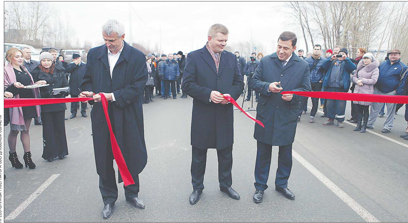
ПРЕСС-СЛУЖБА ГУБЕРНАТОРА СВЕРДЛОВСКОЙ ОБЛАСТИ

— Мы гордимся, — ответил Владимир Путин немецки.