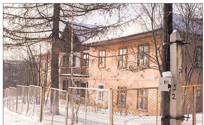
Старому зданию тубдиспансера в Краснотурьинске — 60 лет. Но ежедневно ездить в Серов местные врачи и больные туберкулёзом не хотят. Внутри стационар выглядит вполне современно