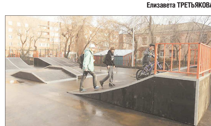
На асфальтовой площадке 21 на 19 метров установлены 7 спортивных снарядов разного уровня сложности

Местные экстремалы давно ждали собственную площадку для тренировок: во дворах трюки на скейтах или BMX-велосипедах делать неудобно. Теперь у них появился мини-скейт-парк. В администрации напомнили, чтобы невянянские любители экстремального спорта не забывали пользоваться комплектами «защиты».