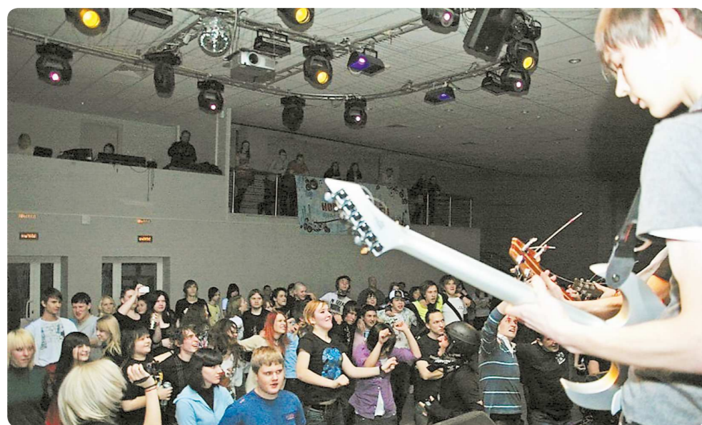
На концерте в провинции зрители ведут себя раскованнее

В Екатеринбурге эти музыкальные группы не собирают многотысячные залы, но у себя в городе стали настоящими звёздами. На гастролях в провинции они выступают в местных клубах, школах, домах культуры... И не избалованные концертами зрители каждый раз встречают их с распростёртыми объятиями.