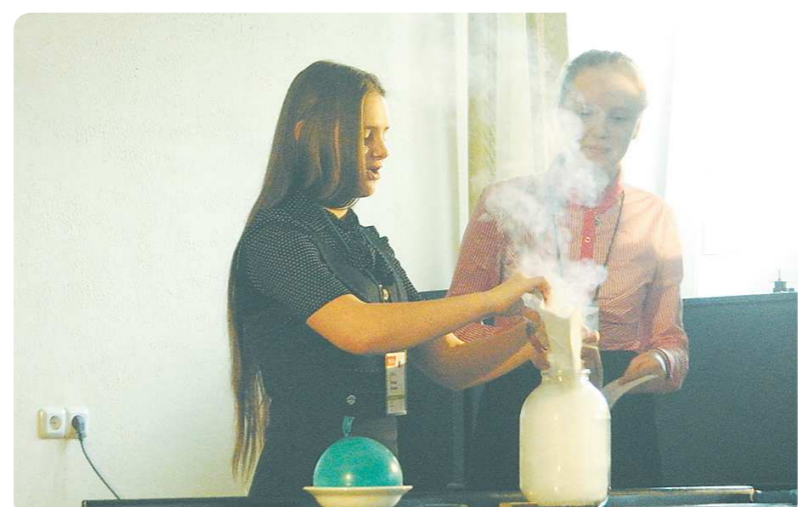
Участницы опыта хотели, чтобы воздушный шарик попал в нагретую банку, но что-то пошло не так...

По коридору летали бутылки, надувались и лопались мыльные пузыри, нагретые банки, остывая, втягивали в себя воздушные шары. 250 школьников из России и Казахстана приехали в Екатеринбург на второй Уральский физический турнир, который проходил в Специализированном учебно-научном центре Уральского федерального университета. Четыре дня подростки проводили опыты и решали задачи, борясь за призовые места.