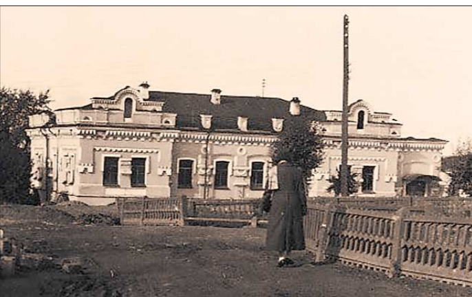
Дом Ипатьева. 1920-е. Первые два окна слева и два с торца — покой Николая II и Александры Фёдоровны, а также наследника — царевича Алексея. Третье окно с торца — покой великих князей Татьяны, Ольги, Марии и Анастасии. Под торцевыми окнами виднеется полукруглое — окно подвала, в котором семья была расстреляна

тие студентов университета и квартир советских служащих. Позже там расположился основной фонд Областного партийного архива и Уральский филиал Музея Революции и Антирелигиозного музея. Одними из последних контор, разместившихся здесь, стали филиал государственного Челябинского института культуры и городского агентства «Союзпечать». Уже к лету 1977-го все конторы съехали из Ипатьевского особняка. Был подписан приказ Андропова о сносе: «В последнее время Свердловск начал посещать зарубежные специалисты. В дальнейшем круг иностранцев может значительно расширяться, и дом Ипатьева станет объектом их серьёзного внимания». Это