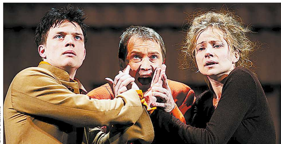
Спектакль «Калигула» - вторая (после «Вишневого сада») совместная работа легендарного режиссёра Зймунтаса Някрошюса и Евгения Миронова

Что мы видим сейчас? Наши театры давно перестали приглашать на серьёзные международные фестивали. Я не помню, когда, кроме разве что времён «холодной войны», к нам было такое отношение, как сейчас. Мне хочется, чтобы мы интегрировались в мировое театральное сообщество на высоком уровне. К этому сейчас есть шаги — в том числе это международные совместные проекты Театра наций. Мы должны попасть в это культурное пространство — и показать, что умеем что-то своё.