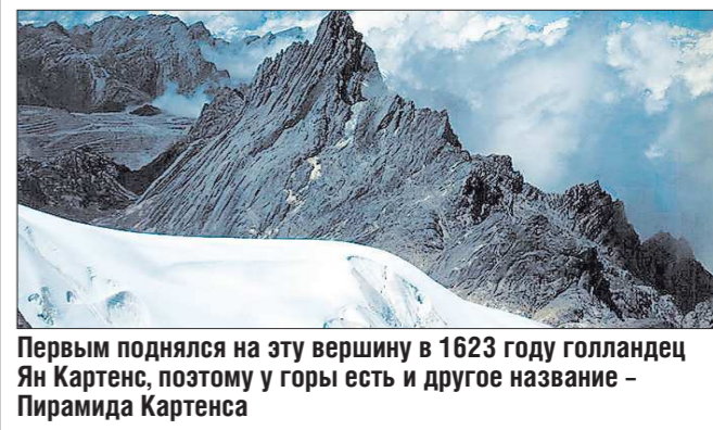
Первым поднялся на эту вершину в 1623 году голландец Ян Картенс, поэтому у горы есть и другое название — Пирамида Картенса