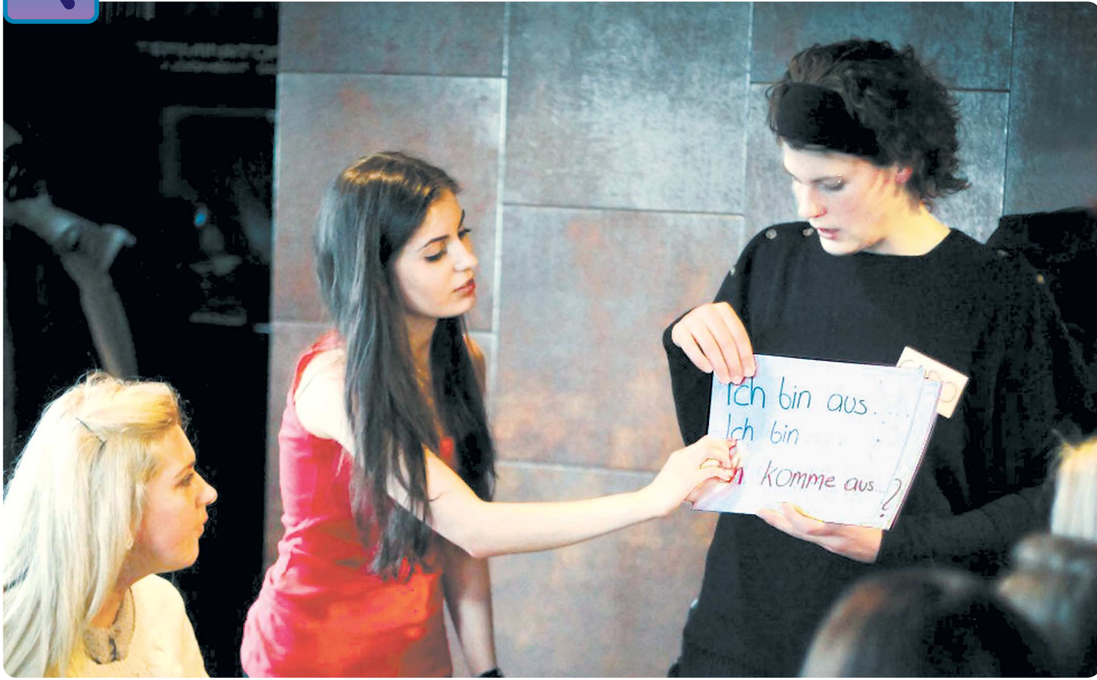
Посетители разговорных клубов в буквальном смысле находят общий язык