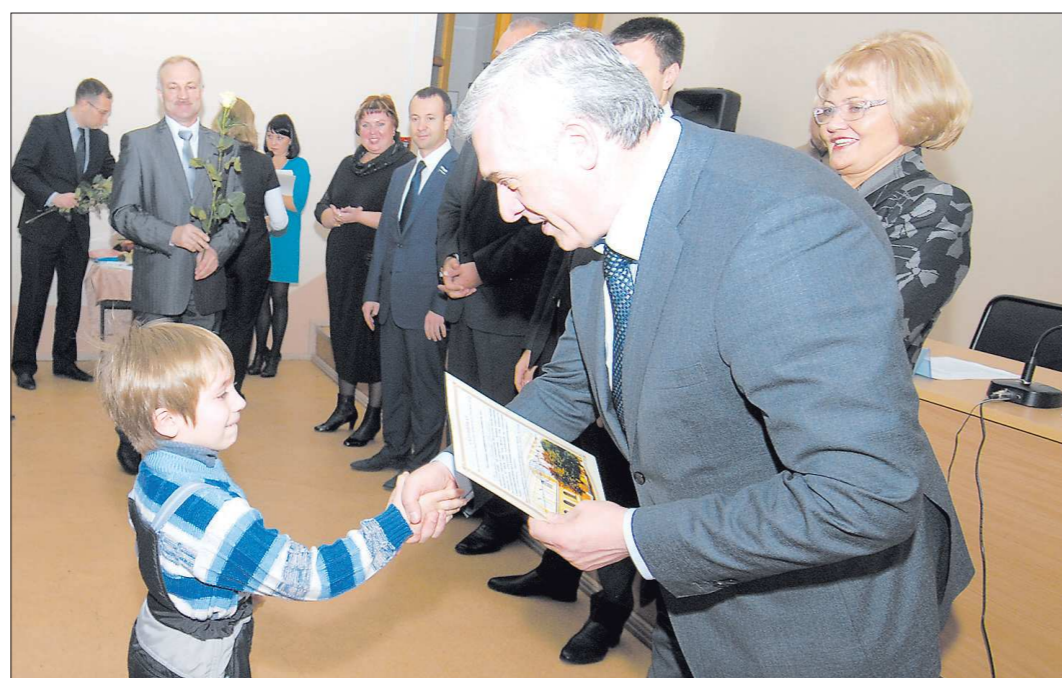
Вице-губернатор — руководитель администрации губернатора Свердловской области Яков Силин вручает сертификат юному камышловцу

—Это будет первый муниципалитет в Свердловской области, где в полном объёме на текущий момент ликвидирована очередь многодетных семей по однократному бесплатному предоставлению земельных участков. Мы надеемся, что этот пример послужит хорошим образцом для других муниципалитетов в решении этой задачи. На достаточно высокой степени готовности находятся матери-