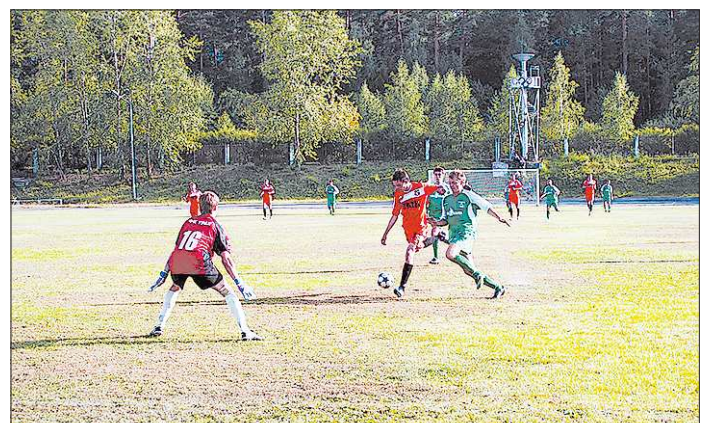
В трёх группах чемпионата области по футболу участвуют более ста команд и более двух тысяч футболистов

Чемпионат Свердловской области по футболу завершился победой первоуральского «Динура». Звание лучшей команды области первоуральцы вернули себе после двухлетнего перерыва.