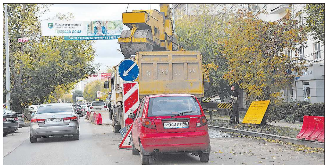
В этом году Екатеринбург получил из областного бюджета более одного миллиарда рублей на ремонт и реконструкцию дорог

До полного вывоза концетрата (в договоре срок обозначен до 2026 года) безопасность его хранения будет по-прежнему обеспечивать наш «УралМонолит», только вот расходы на это станут нести покупатель.