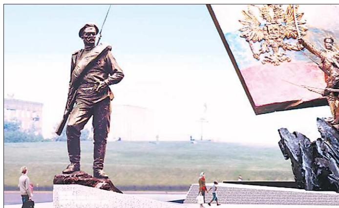
Скульптуру участника сражений Первой мировой установят в Москве на Поклонной горе (напротив цветочных часов)