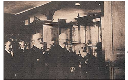
Фритьоф Нансен (в центре на переднем плане) во время посещения Екатеринбургского музея

100 лет назад (в 1913 году) в Екатеринбурге побывал знаменитый норвежский исследователь Фритьоф Нансен, которому за две недели до этого исполнилось 52 года. Он совершал путешествие по восточной части России и задержался в нынешней столице УрФО всего на один день.