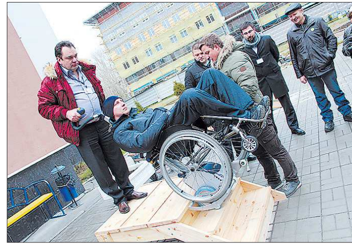
С лестничным подъемником «ПУМА» инвалидам будет намного легче подниматься по этажам