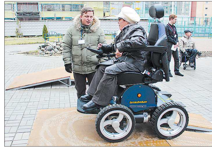
Эту трехколесную коляску уже окрестили «джипом» – она развивает скорость до девяти километров в час