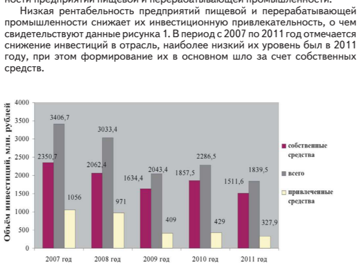
Рисунок 1. Объем инвестиций в основной капитал в ценах соответствующих лет

Для предприятий пищевой и перерабатывающей промышленности Свердловской области характерна такая же негативная тенденция, как и для большей части прочих российских пищевых производств: высокая доля износных как физические, так и морально основных фондов, тогда как их обновление происходит с недостаточной степенью интенсивности. Предприятия пищевой промышленности Свердловской области не в полной мере используют имеющиеся производственные мощности, что свидетельствует о сдвиге от стороны, о насыщенности рынка продуктами питания, автенированными из других областей, с другой — о наличии задействованных энергозатратных мощностей большой производительности (хлебопекарная, молочная, мясная промышленности). Физический износ и моральное старение основных фондов являются главными причинами недопустимо высокого уровня образования отходов производства, сброса неочищенных производственных стоков в открытые водоемы и выбросов промышленных загрязнений в атмосферу.