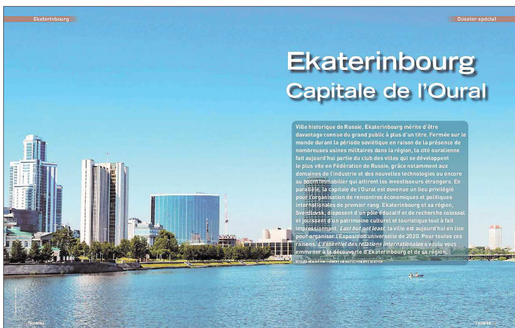
В парижском журнале подробно рассказано о Екатеринбурге, его жителях и достопримечательностях