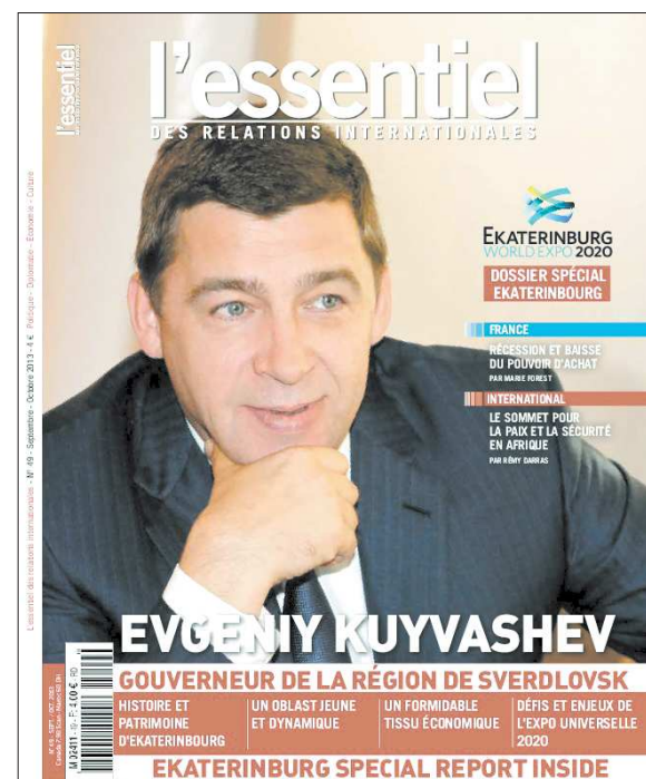
«L'Essentiel» – популярный журнал, освещающий международные политические, экономические, культурные события. Распространяется многотысячными тиражами более чем в двадцати странах. Его обложку украсили портреты канцлера Германии Ангелы Меркель, президента США Барака Обамы, других известных политиков и бизнесменов

тра Великого как промышленный центр России. Сегодня Екатеринбург – активно развивающийся город, обладающий развитой инфраструктурой. Один из лидеров по инвестиционному привлекательности». Благодаря Всемирной универсальной выставке двадцатого года город станет мировой площадкой для дискуссий, а значит, получит новый импульс развития. На парижской презентации сделан ещё один шаг к цели. Представители Заявочного комитета рассказали гостям Российского культурного центра о Екатеринбурге и Свердловской области, о проекте ЭКСПО-парка. Как рассказал представитель Заявочного комитета ЭКСПО-2020 в Екатеринбурге Константин Пудов, презентация прошла успешно. – По мнению большинства участников презентации, за время активной заявочной кампании столица Урала значительно повысила свою узнаваемость в мире, а значит, и свою международную инвестиционную привлекательность, – подчеркнул он.