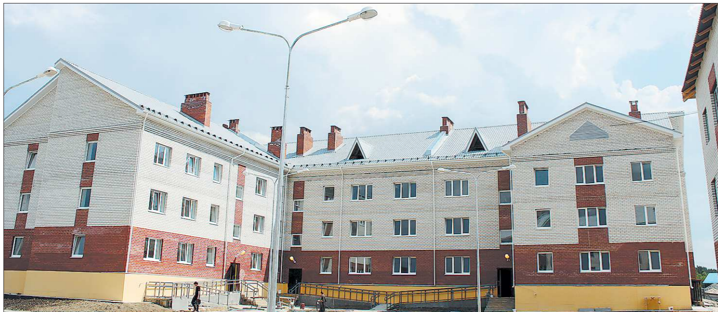
Квартиры в берёзовской новостройке, куда не хотят переезжать жители старых трущоб, могут перейти в муниципальный маневренный фонд