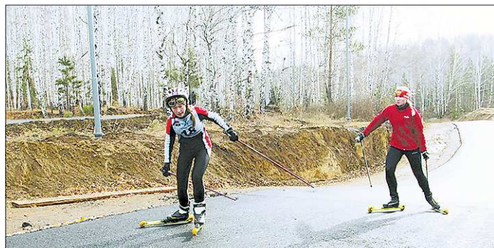
Теперь лыжники в Каменске-Уральском могут готовиться к соревнованиям ещё до того, как выпадет снег

К слову, ленточку на открытии самой базы перерезали уже давно: идея строительства начала воплощаться ещё два года назад. А в 2012-м, когда в готовом здании открылся прокат лыж, появились и первые посетители. Правда, изначально задумка была глобальнее — начать готовить будущее поколение лыжников и биатлонистов. Оказалось, что в таком непростом деле не обойтись без трассы, на которой можно проводить не только соревнования, но и учебно-тренировочные занятия по гонкам на лыжероллерах.