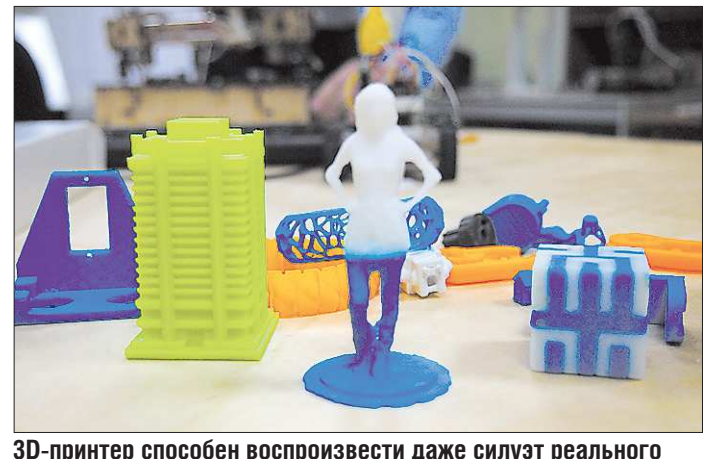
3D-принтер способен воспроизвести даже силуэт реального человека. Полученную фигурку можно раскрасить красками вручную, как здесь, или сразу вести печать пластиком разных цветов