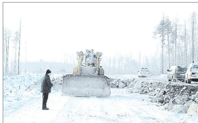
Ещё недавно проехать по дороге от Ивделя до Ханты-Мансийска было нелегко, всюду шла стройка

+/- — рост / падение по отношению к предыдущему показателю