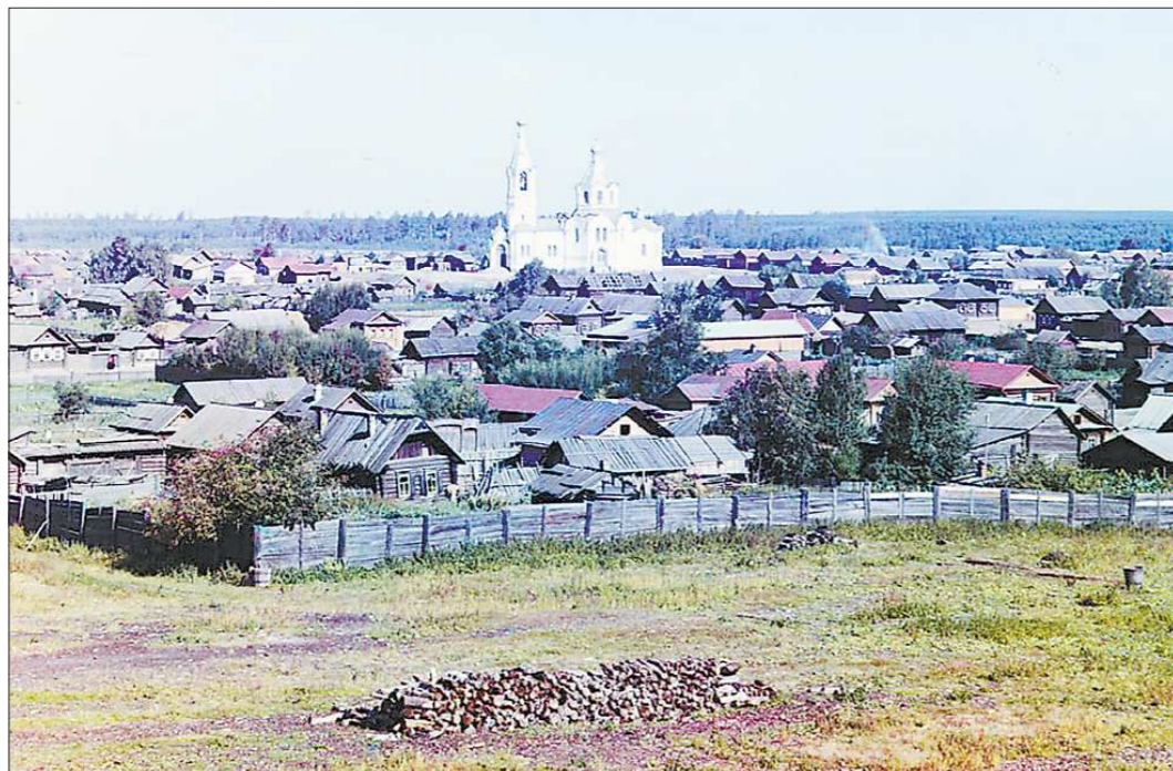
Вид на посёлок Верх-Исетского завода. Заречная часть. В центре снимка Никольская церковь (освящена в 1897 году). Она стояла на торговой площади (сейчас это территория «птичьего рынка»)

В 2013 году отмечается 150-летие со дня рождения Сергея Прокудина-Горского. В год столь солидного юбилея как не вспомнить, что осенью 1910 года пионер цветной фотографии в России, на полвека опередивший время, был в Екатеринбург. Благодаря ему мы сегодня можем увидеть в цвете исторические памятники, знаменитых людей, например, Шалапина и Толстого. А ещё — панорамы и виды крупнейших городов Российской империи. В том числе Екатеринбурга... Здесь Прокудин-Горский, по разным данным, пробыл с сентября по конец октября.