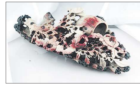
Китайские резчики создавали изделия из самых разных материалов: от бамбука до рога и янтаря