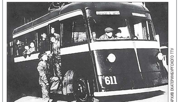
Выезд из гаража первого в Екатеринбурге троллейбуса. 1943 год