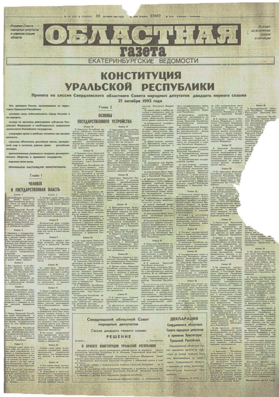
Как и все другие важнейшие документы регионального уровня, Конституция Уральской республики была опубликована на страницах «Областной газеты»

Но, на мой взгляд, при создании Конституции был упущен исторический шанс: мы не отказались от советского наследия в части административно-территориального деления. Чтобы заложить действитель-