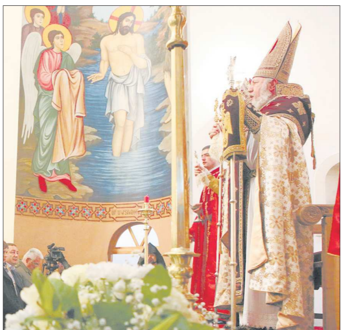
Католикос всех армян Гарегин II освящает храм в столице Урала