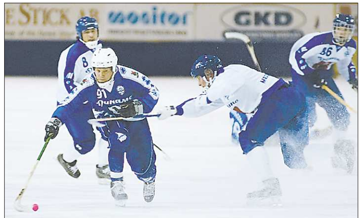
Два российских клуба провели в Сандвикене для шведов мастер-класс