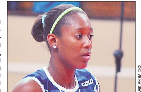
Следующая игра пройдёт снова на выезде — 15 октября «Уралочка» сыграет против «Тюмени-ТюмГУ».

Календарь в начале сезона для «Уралочки» оказался непростым: первые четыре тура команда играет в гостях. Две стартовые встречи наши волейболистки проиграли, но в матче против клуба из Уфы ситуация удалось перевернуть. Свердловчанки выиграли встречу 3:1 (24:26, 25:19, 25:20, 27:25).