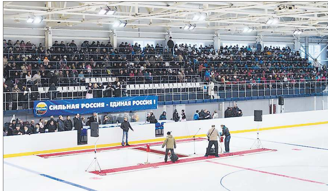
Теперь не только хоккеисты «Энергии», но и их верные болельщики будут находиться в комфортных условиях