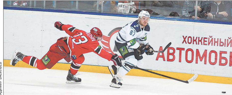
Встреча против действующего обладателя Кубка Гагарина закончилась со счётом 2:4. Екатеринбургцы, казалось, уже спасли матч во втором периоде. И даже реализовали большинство, что никак не удавалось сделать в трёх последних играх. Однако динамовцы подтвердили свой статус в третьем периоде. По мнению главного тренера «Автомобилиста», сделали они это не без помощи судей...