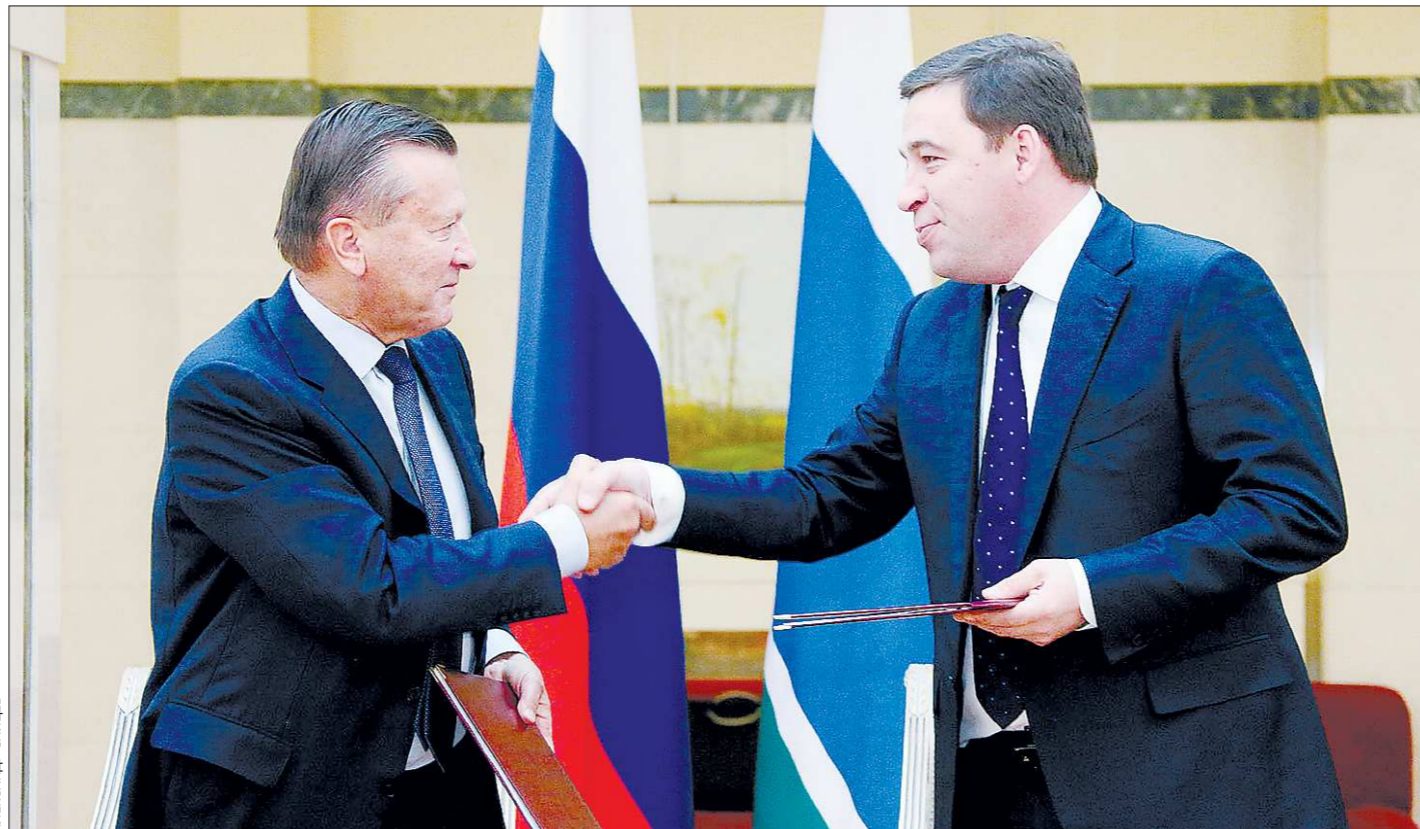
Виктор Зубков и Евгений Куйвашев запускают проект, который не только сделает газомоторное топливо более доступным для уральцев, но и обеспечит жителей нашего региона новыми, высокотехнологичными рабочими местами

Вчера Евгений Куйвашев подписал соглашение, способное сделать реальностью массовый перевод автомобилей с бензина и солярки на газ