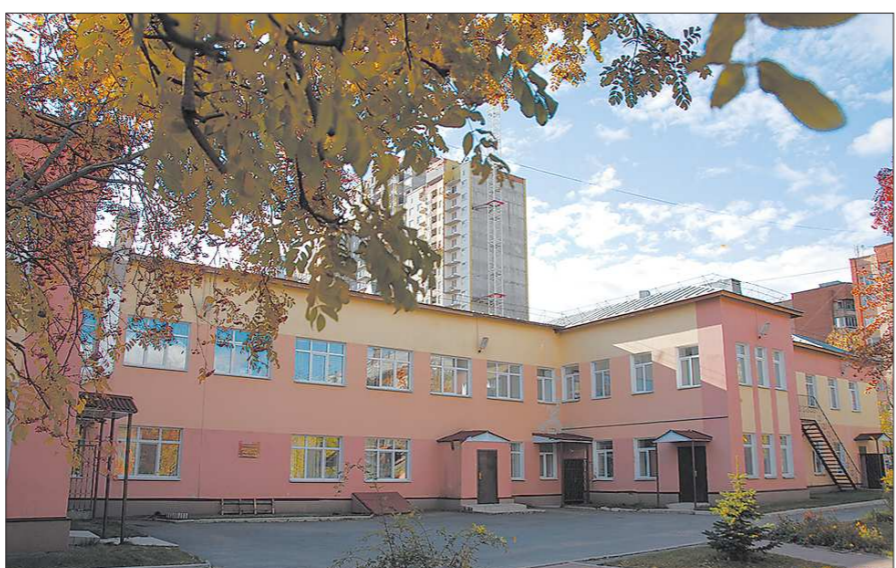
Вот такой детский сад №34 в Екатеринбурге признали устаревшим и решили возвести на его месте новый, на 280 детей

То есть никто ни от чего не застрахован. Но на плохое настроение не стоит. Вот только, если мучает бессонница или раздражительность мешает общению с окружающими, или настроение отвратительно держится день за днём, лучше обратиться к специалисту. О себе, любимом, лучше позаботиться вовремя.