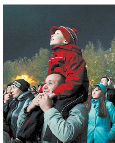
Жюри признало их программу лучшей на фестивале