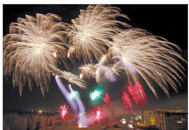
Больше всего зрителям понравилось выступление мальтийских пиротехников. Жюри признало их программу лучшей на фестивале

музей, расположенный в здании со статусом «памятник культурного наследия», получит финансовую поддержку только в 2015 году. Жаль, что горожане не открылись от традиции в честь юбилей открывать какой-нибудь социальный объект. Это очень затратные позиции, а каких-то особых предпочтений города-юбилера не имеют. Празднуют так, как позволяют средства.