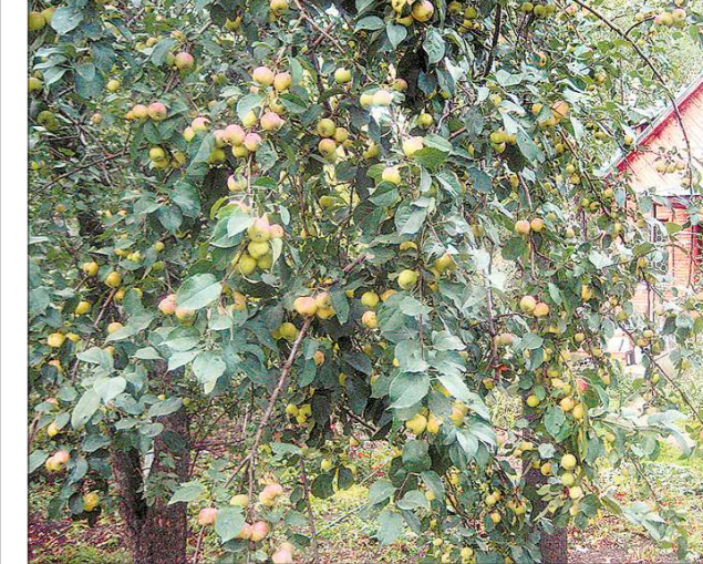
Сейчас в музейном саду чисто, плоды остались только на одном дереве. Это ранетка сорта «Здоровье» — с повышенным содержанием каротина. Жёлто-красные плоды директор музея обещает помочь собрать первому, кто постучится в ворота. Говорит, из них получается отличный сок

Заходили и чиновники из «Белого дома» по соседству — взяли немного «погрызть». А за остальными приехали из станции Державной, что под Среднеуральском. Здесь находится центр реабилитации бездомных «Держава», который принимает людей, попавших в сложные жизненные ситуации. Для хозяйства, которое ведёт реабилитацию (они и скот выращивают), яблоки очень пригодятся. С собой казаки увезли не только плоды, но и саженцы для станичного сада.