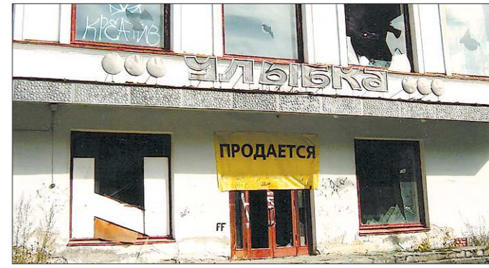
Товарный вид у бывшего кафе оставляет желать лучшего