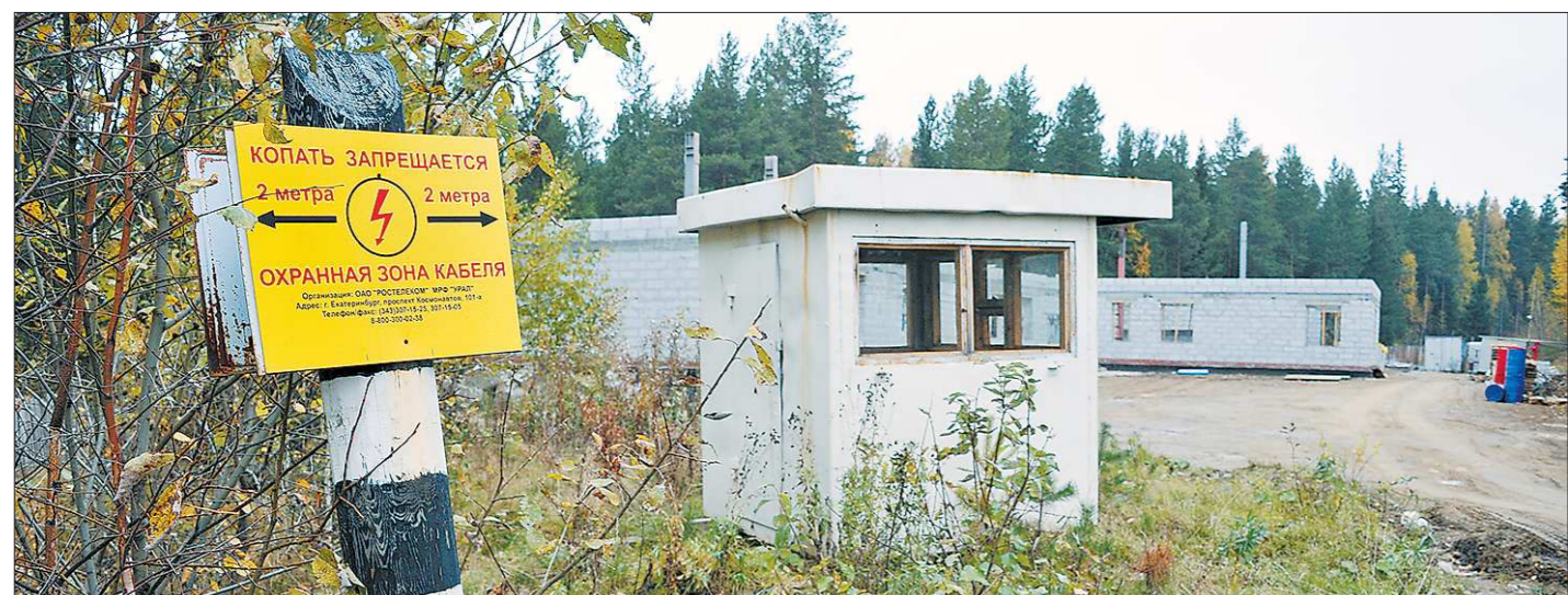
При возведении гостиницы и кафе на территории заказника не нарушили разве что охранную зону кабеля

1 октября (14 октября по новому стилю) 1878 года открылось постоянное движение поездов по маршруту Екатеринбург-Пермь. Кстати, строительство дороги подарил Екатеринбург и Пермь по красивой постройке в здании вокзала в стиле модерн. Год постройки у них один и тот же — 1878-й.