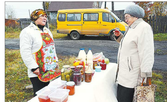
Представленные на ярмарке дары никитинских подворий можно было продегустировать

Жители и гости деревни Никитино отметили «Праздник урожая», который был организован местным центром художественного творчества в рамках празднования 235-летия Верхней Салды. На ярмарке сельчане презентовали то, что выросло у них на грядках и в теплицах, а местная детвора с удовольствием приняла участие в игровой программе, сообщает сайт vsalde.ru. Ирина АРТАМОНОВА