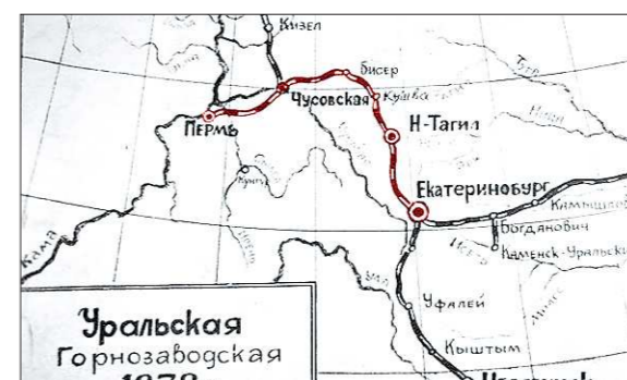
Уральская Горнозаводская 1878 г. Железная дорога. Линия от Перми до Екатеринбурга составляла 468 вёрст

да. Акт приёмки правительственной комиссией выглядит как текст наградной грамоты: «По своей рациональности и законченности, при крайне трудных топографических и климатических условиях УГЖД может быть признана образцом для будущих сооружений». Интересно, что этим «образцом» тут же успешно и воспользовались — в 1886 году при строительстве линии от Екатеринбурга до Тюмени.