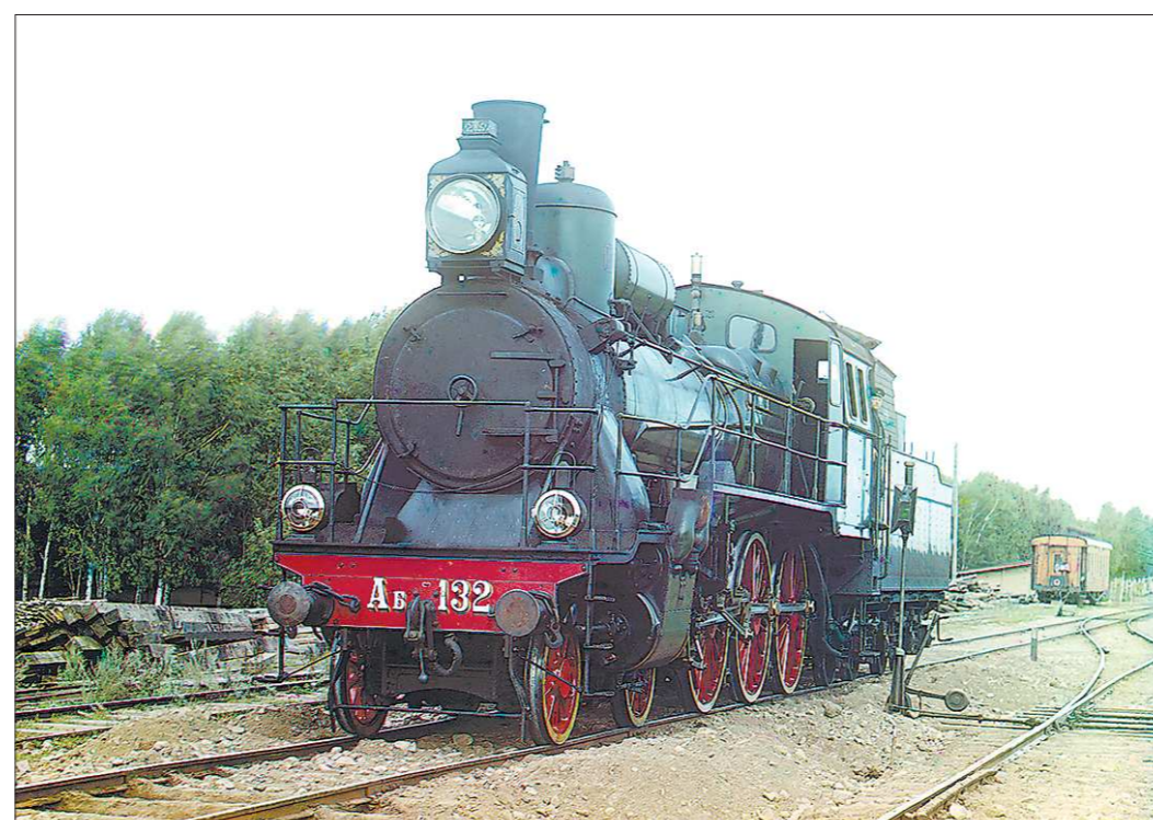
1910 год, паровоз на станции возле Перми. К этому времени Уральская горнозаводская железная дорога была переименована в Пермскую с управлением, соответственно, в городе Перми. Свердловской она стала в 1953 году