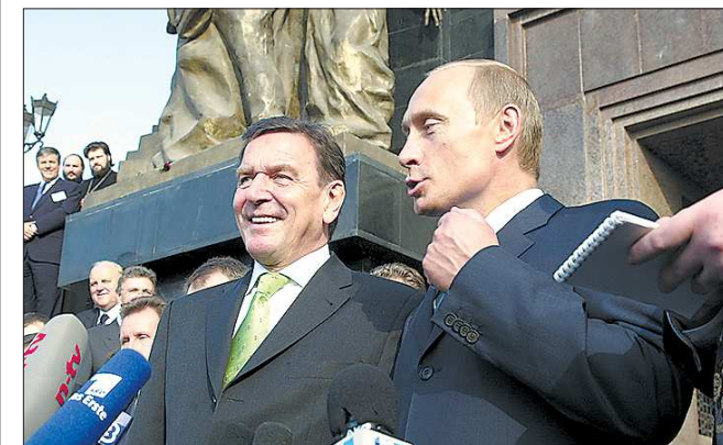
Герхард Шрёдер и Владимир Путин возле екатеринбургского Храма-на-Крови