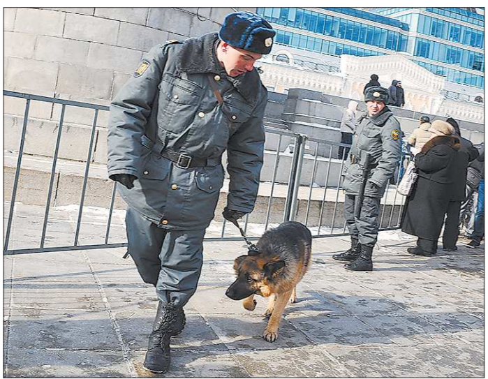
«Ну что, дружок, пора и поработать...»

Правда, нынче срочников с собаками на границу, как в Советском Союзе, не отправят: эти войска полностью перешли в структуру Федеральной службы безопасности, и сейчас туда берут лишь контрактников. Заочет призванный служить со своим умным и дисциплинированным псом – его возьмут во Внутренние войска. Кстати, с октября по декабрь 2013 года свердловские военкоматы призывают в них 683 человека.