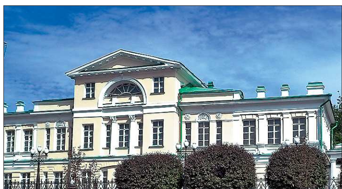
История камнерезного искусства прочно вплетена в историю всего Урала. Поэтому неслучайно в самом сердце Екатеринбурга есть музей, где камни — это не просто полезные ископаемые, но и свидетели эпохи

В 1894 году здание расширяют — дополняют боковыми пристроями. Думаете, дела у аптеки пошли на лад? Или в связи с эпидемией холеры потребовалось расширить производство? Нет. К девятидесяти годам XIX века внешнее оформление стало соответствовать внутреннему содержанию — здесь был