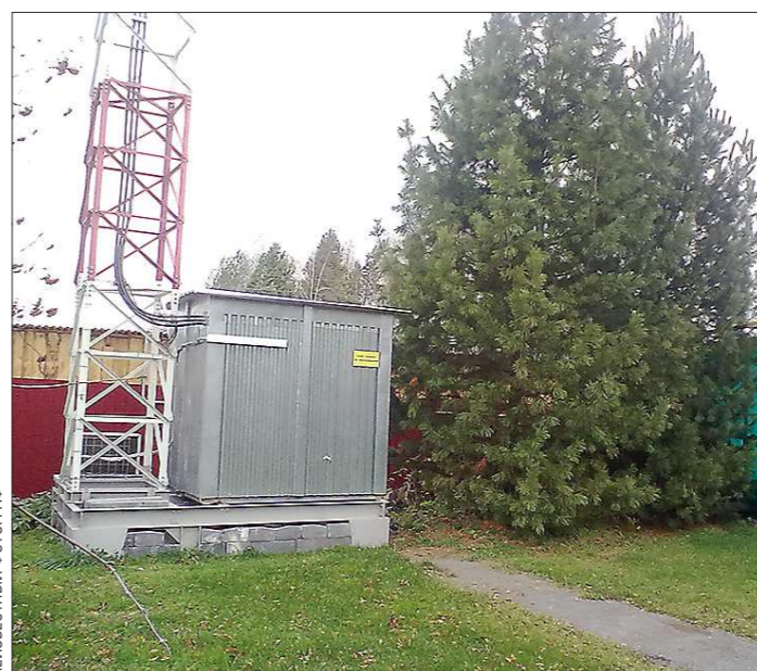
Дали землю под сад - выращивай деревья, а не мачты сотовой связи