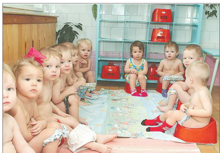
Через 10 лет каждая семья должна будет родить не одного-двух, а трёх-четырёх детей, чтобы страна снова не провалилась в демографическую яму...