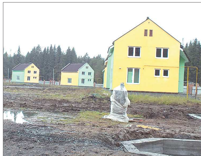
Государство подарило муниципалитету благоустроенное жильё, а привести территорию в порядок ветеранцы смогут сами