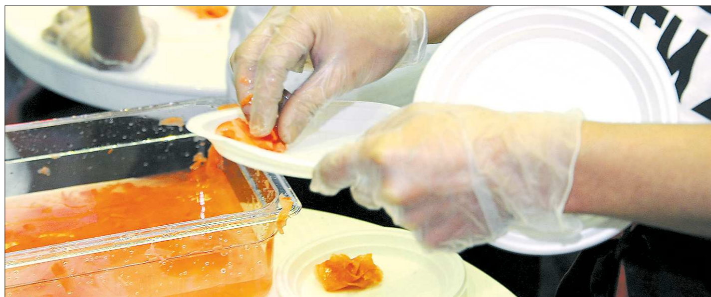
Не только повар должен знать, как и из чего приготовлено блюдо