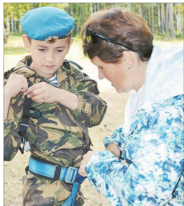
Самый юный десантник оборонно-спортивного лагеря имени капитана Ф.Пелевина