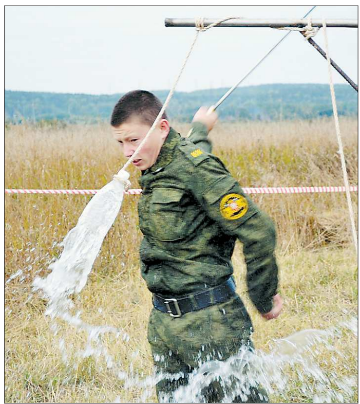
Накануне Спартакиады в Екатеринбургском кадетском корпусе провели казачий праздник — шермичи. Рубка шашкой на бегу бутылок с водой стала одним из самых зрелищных состязаний