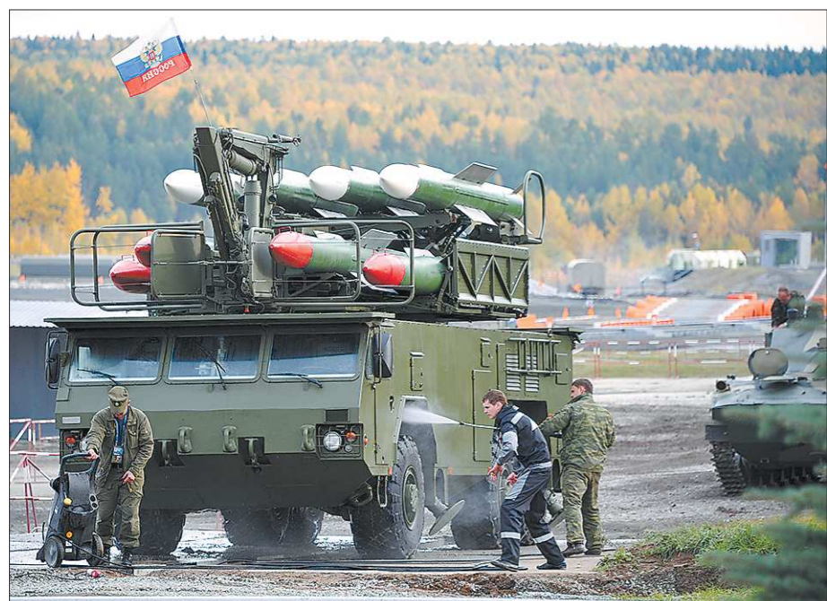
Суровая боевая техника порой требует нежного ухода: транспортно-заряжающая машина ракетного комплекса «принимает душ» после показательного выступления