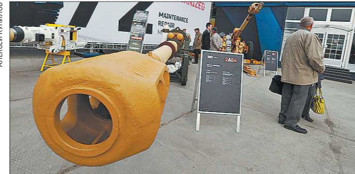
Первые гаубицы били каменными ядрами. Эта – 152-миллиметровыми снарядами