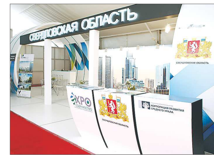
Информационный стенд Среднего Урала в Сочи