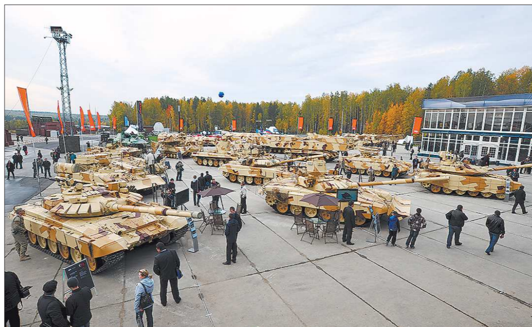
Ох, не зря было сказано, что с таким арсеналом жителям нашей страны можно спать спокойно!