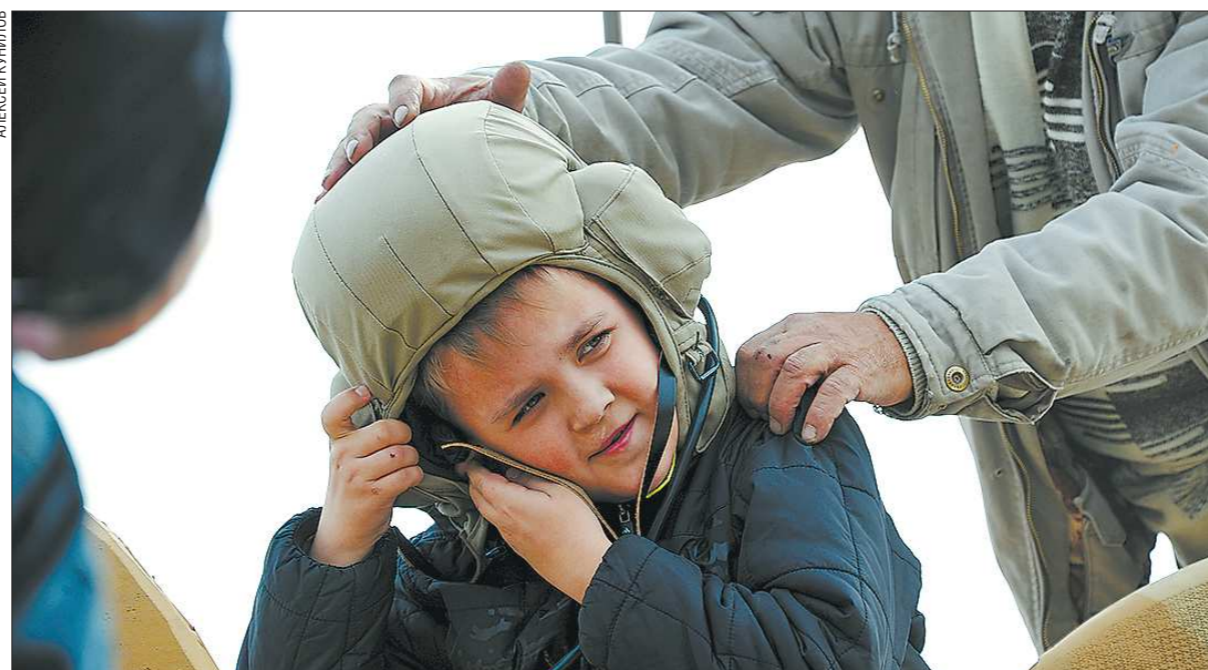
RAE 2013 – настоящий рай для мальчишек! Ну где ещё разрешат залезть в настоящий танк? Кажется, наш герой уже определился с местом службы