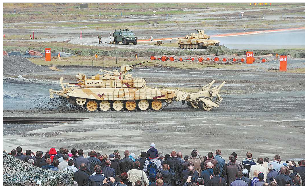
Бронированная машина разминирования в действии

Очередной оружейный салон на полигоне «Старатель» под Нижним Тагилом сегодня завершает свою работу