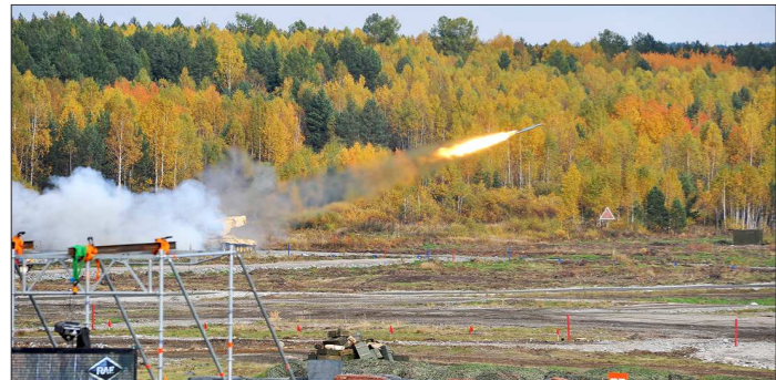
Современные наследники легендарных «Катюш» способны поражать цели на дальности в десятки километров