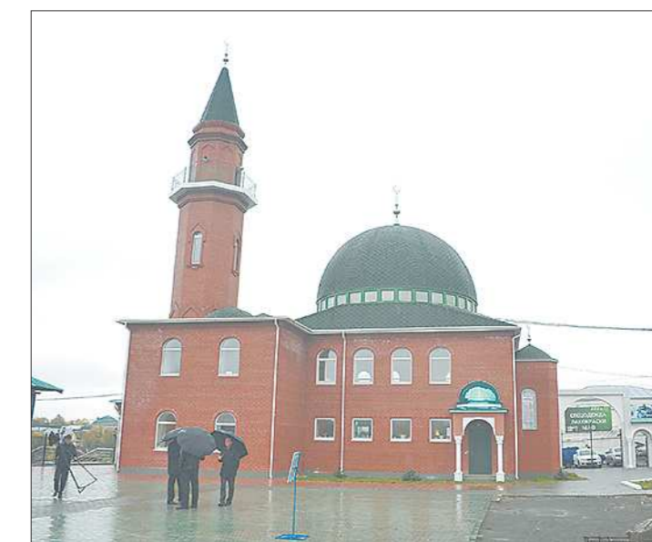
Так выглядит новая мечеть «Рамазан»