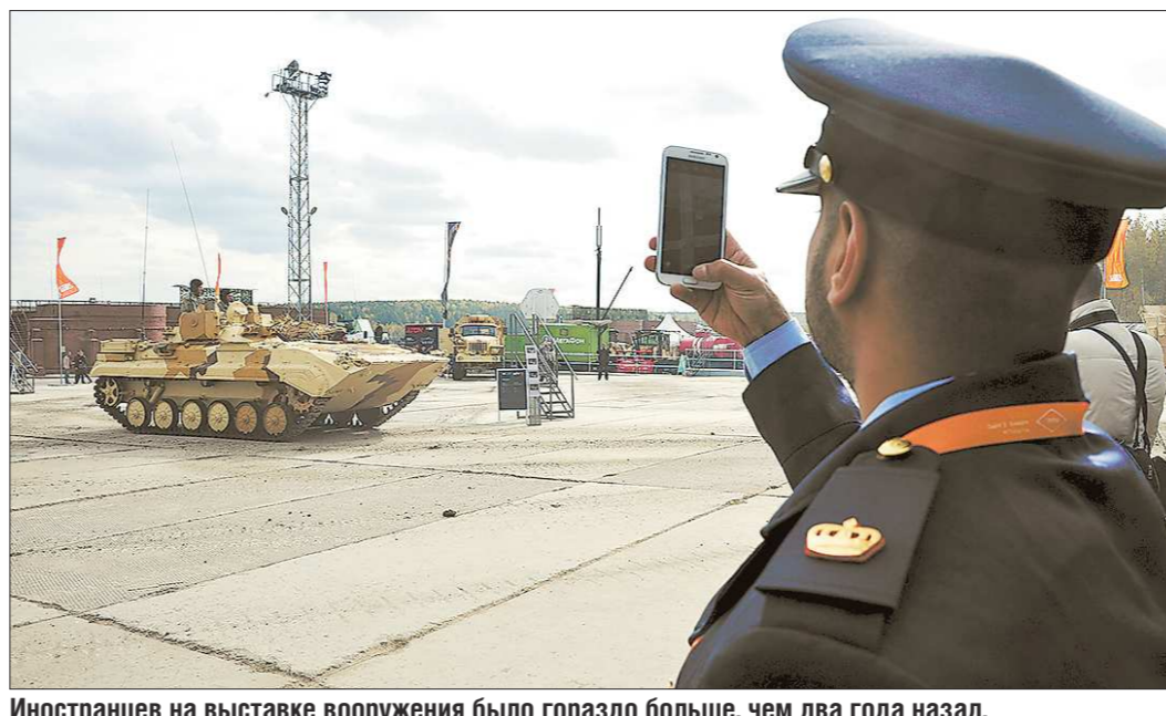
Иностранцев на выставке вооружения было гораздо больше, чем два года назад. Интерес у них не праздный: большинство зарубежных гостей – потенциальные покупатели российского оружия