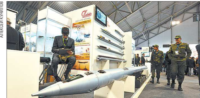
Тула славится не только пряниками, но и такими реактивными снарядами