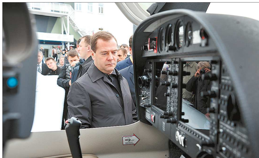
Премьер-министр РФ Дмитрий Медведев провёл на RAE 2013 целый день, а после отметил: выставка вышла на новый уровень

Премьера IX выставки вооружения от Уралвагонзавода – мощнейшая боевая машина «Терминатор-2». Всего УВЗ представил восемь новинок