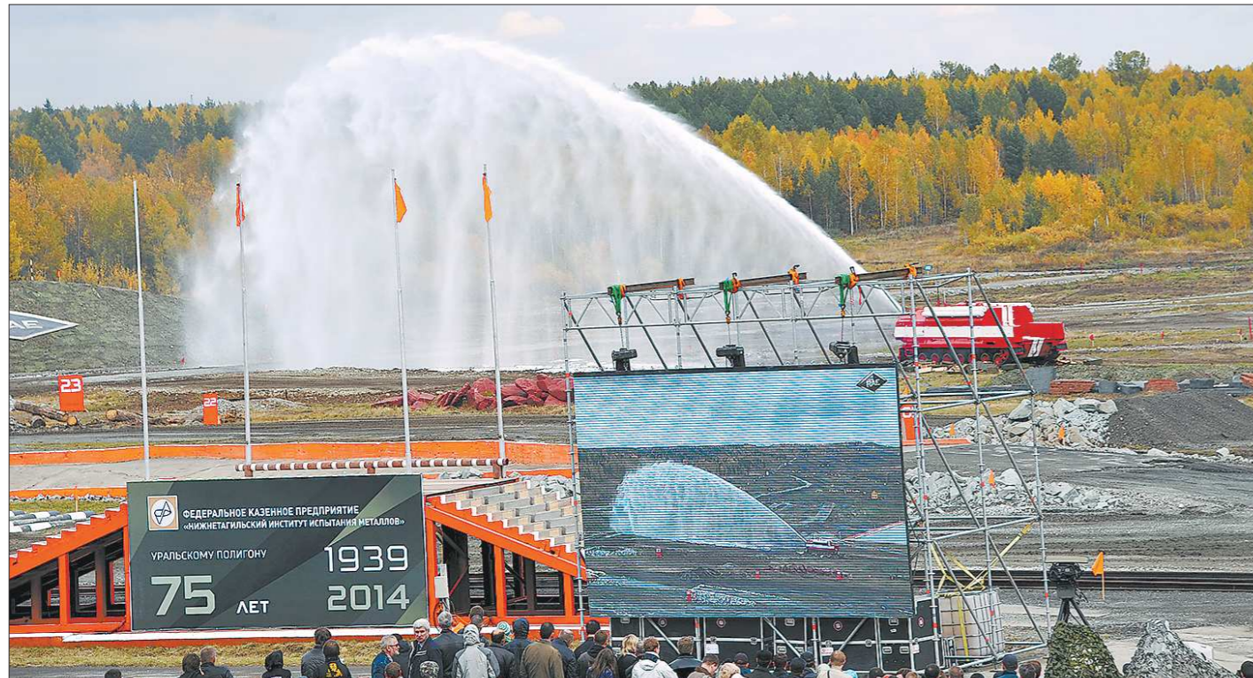
Ещё одна новинка от УВЗ – специальная пожарная машина. В её цистерну запросто поместится маленькое озеро: объём – 25 кубометров