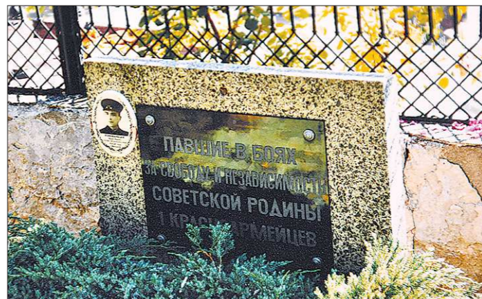
Более двадцати лет сыновья и внук фронтовика искали его могилу в Германии, а нашли в Польше. Надгробие на захоронении установил Польский Красный Крест