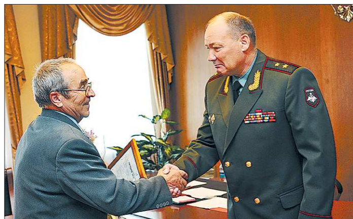
Начальник штаба Центрального военного округа генерал-лейтенант Александр Дворников вручил сыну погибшего лейтенанта удостоверение на награду ордена Красной Звезды