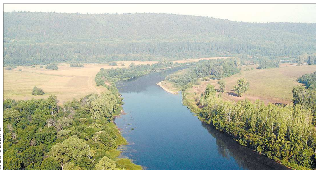
ландшафты. Основная водная артерия Уфы (приток реки Белая Волжско-Камского бассейна) протекает с севера на юг, выбирая притоки: Сарану, Саргаю, Аяз, Бугалыш... Имея на этих рек носят прибрежные сёла и деревни.

Чем «Уфимское плато» интересно туристам? Оно здесь довольно круто обрывается к западному склону Среднего Урала. Многочисленные воронки, пещеры, «исчезнувшие реки» (они тут порой текут в двух ярусах: наверху и под землёй), восходящие источники и промывы. Известняки и гипсы создают здесь причудливо-сказочные