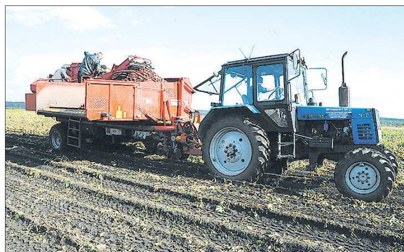
Новая техника позволяет собрать урожай вовремя и без потерь

Материалы о оплате жилищно-коммунальных услуг выходят в «Областной газете» каждую среду и субботу