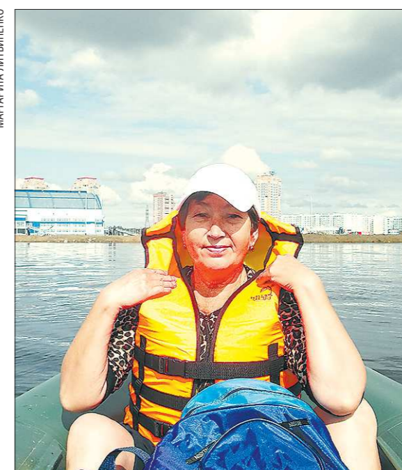
Катера не ходили, и до острова Большой Уссурийский автору этих строк пришлось добираться на весёлой резиновой лодке