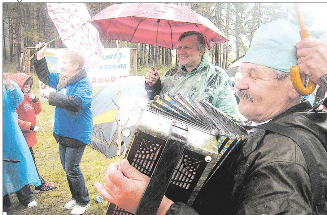
В Артемовском городском округе удачный опыт проведения туристического слёта пенсионеров «Покровский привал» стал поводом, чтобы собрать на гостеприимной Пионерской поляне в окрестностях села Покровское окружной слёт ветеранов Восточного управленческого округа. На нём собрались туристы-пенсионеры из восьми городов области

«Как «Покровский привал» ветеранов собрал»